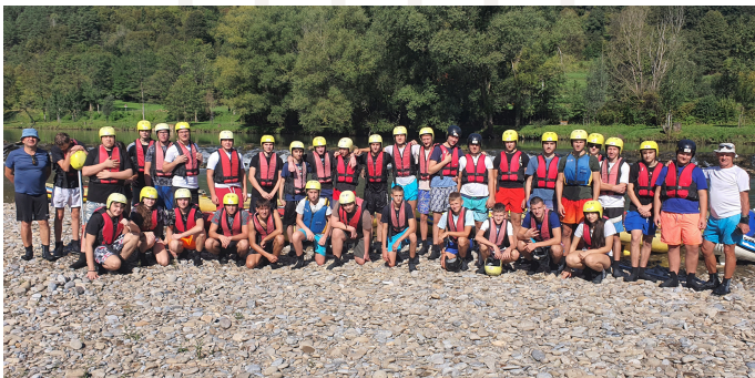
Spoznavna dneva v Radencih.