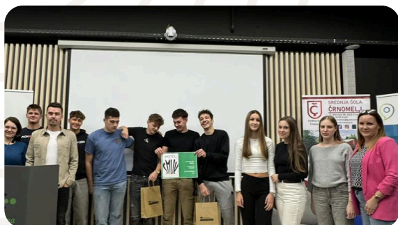
Start-up vikend 2025.