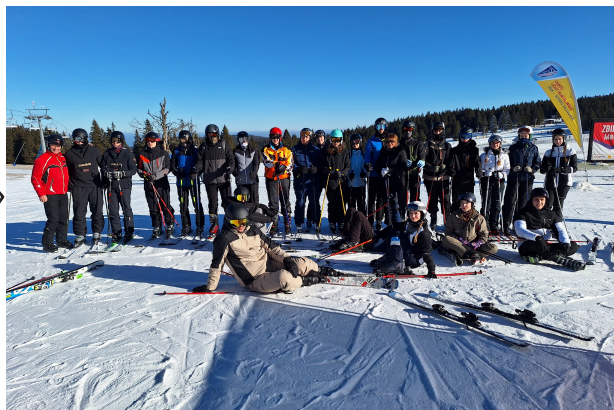
Zimovanje na Rogli.