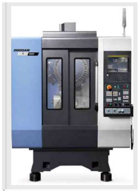
Posodabljam predmetnik in učila

Naši dijaki opravljajo prakso - PUD pri lokalnih podjetnikih.