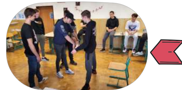
Interesne dejavnosti - aktivno državljanstvo

Veliko športnih aktivnosti, tekmovanje za naj športnika in športnico ter naj športni razred, možnost rekreacije.