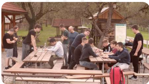
Spoznavni vikend v Radencih.

Sodelovali bomo s srednjo šolo na Hvaru, še posebej na kulturnem in športnem področju.