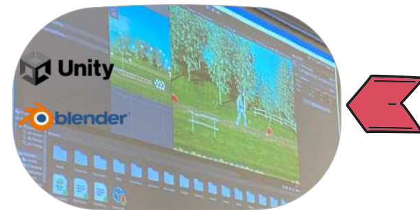
Krožek - USTVARJANJE VIDEOIGRE