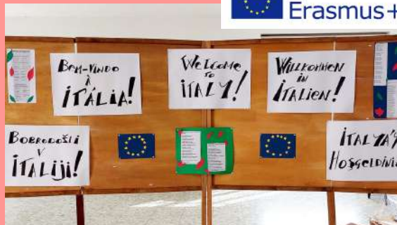
Erasmus+ - 15 letna tradicija izmenjav.