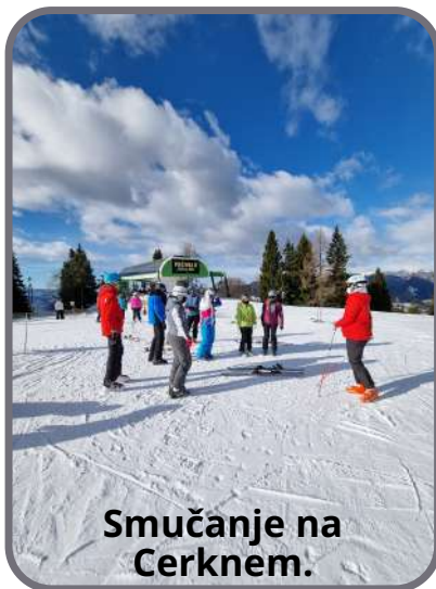
Smučanje na Cerknem.