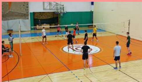
Tekmovanje za naj športnika in športnico ter naj športni razred, rekreacija.