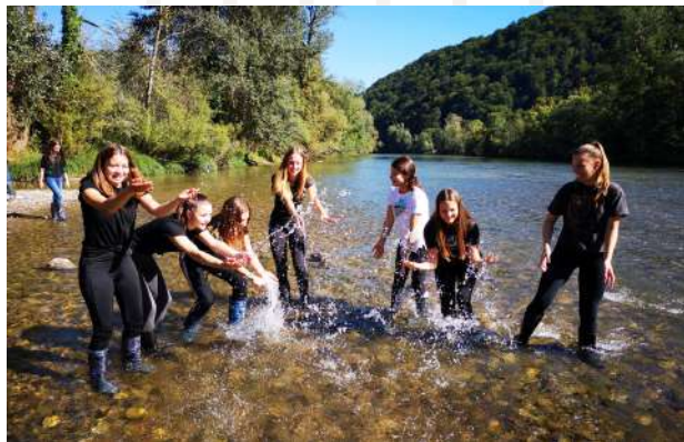
Spoznavni vikend v Radencih.

Pomemben element odprtega kurikula je turizem. Začeli smo sodelovati s srednjo šolo na Hvaru, še posebej na kulturnem in športnem področju.